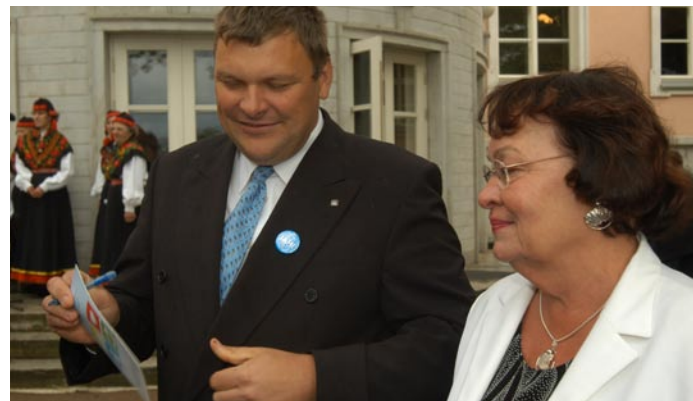
Arutelus peitub lahendus Discussions lead to solutions