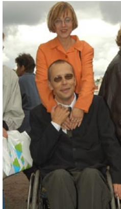
Me kõik vajame tuge We all need care

Eesti elanikkond on 1,3 miljonit inimest, kellest umbes 10%-l on üks või teine puue. See teeb kokku rohkem inimesi, kui elab Eesti suuruselt teises linnas Tartus. Paljud nendest on puuetega inimeste organisatsioonide liikmed, paljud aga veel üritavad leida oma teed.