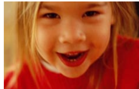
Lapsed - elurõõm Children are our joy and pride

Modern disability movement stated developing in the end of 1980-ies, when disability issues were brought into daylight. Many organisations were established in the beginning of 1990-ies and celebrated their 10th anniversary in 2002 - 2003.