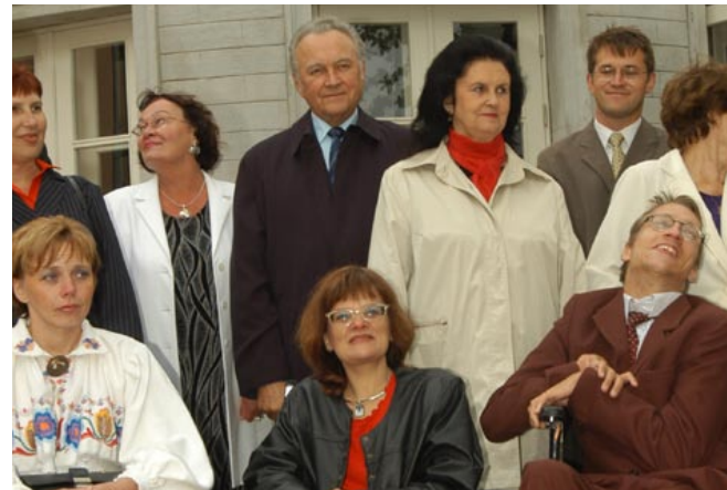
Presidendi vastuvõtt Reception of the President

Representatives of Chamber member organisations participated on 17th – 22nd of August on a joint Danish-Estonian