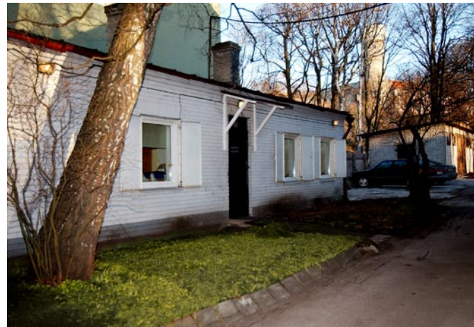
Meie renoveerimisootel maja Our, soon to be, renovated house

Soovime, et maailm kuuluks meile kõigile!