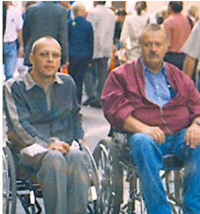
Seminaril Kopenhaagenis Seminar in Copenhagen

12th December 2002 the co-operation project among The Estonian Chamber of Disabled People and The Danish Council of Organisations of Disabled People, called "Creation of dialogue on needs of disabled people dedicated to European Year of People with Disabilities 2003" was opened at the Conservatory of "Estonia" theatre.