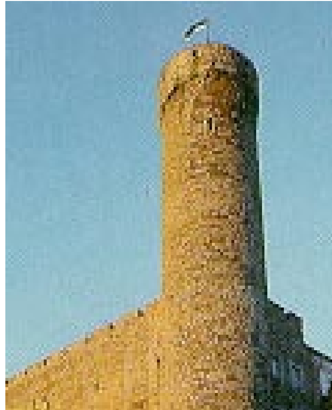
Vaade Toompeale A view to the Parliament