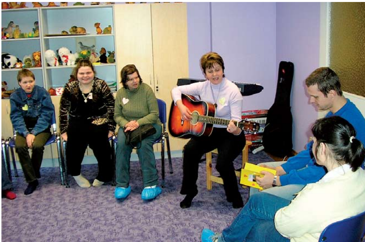
Muusikatund Ida-Virumaa Puuetega Inimeste Kojas.

ja päevakeskus puuetega lastele”. Projektiga tegelesime kokku 4,5 aastat ning nende aastate jooksul puutusime kokku nii hea kui halvaga, kuid ühise töö tulemusena võib tänaseks rahul olla. Tänu nimetatud projektile on Jõhvi valla ja ümberkaudsete omavalitsuste erivajadusega lastele tagatud turvaline õppekeskkond kaas-aegsetes ruumides. 14 aasta jooksul on koolis õppinud juba üle 50 puudega lapse.