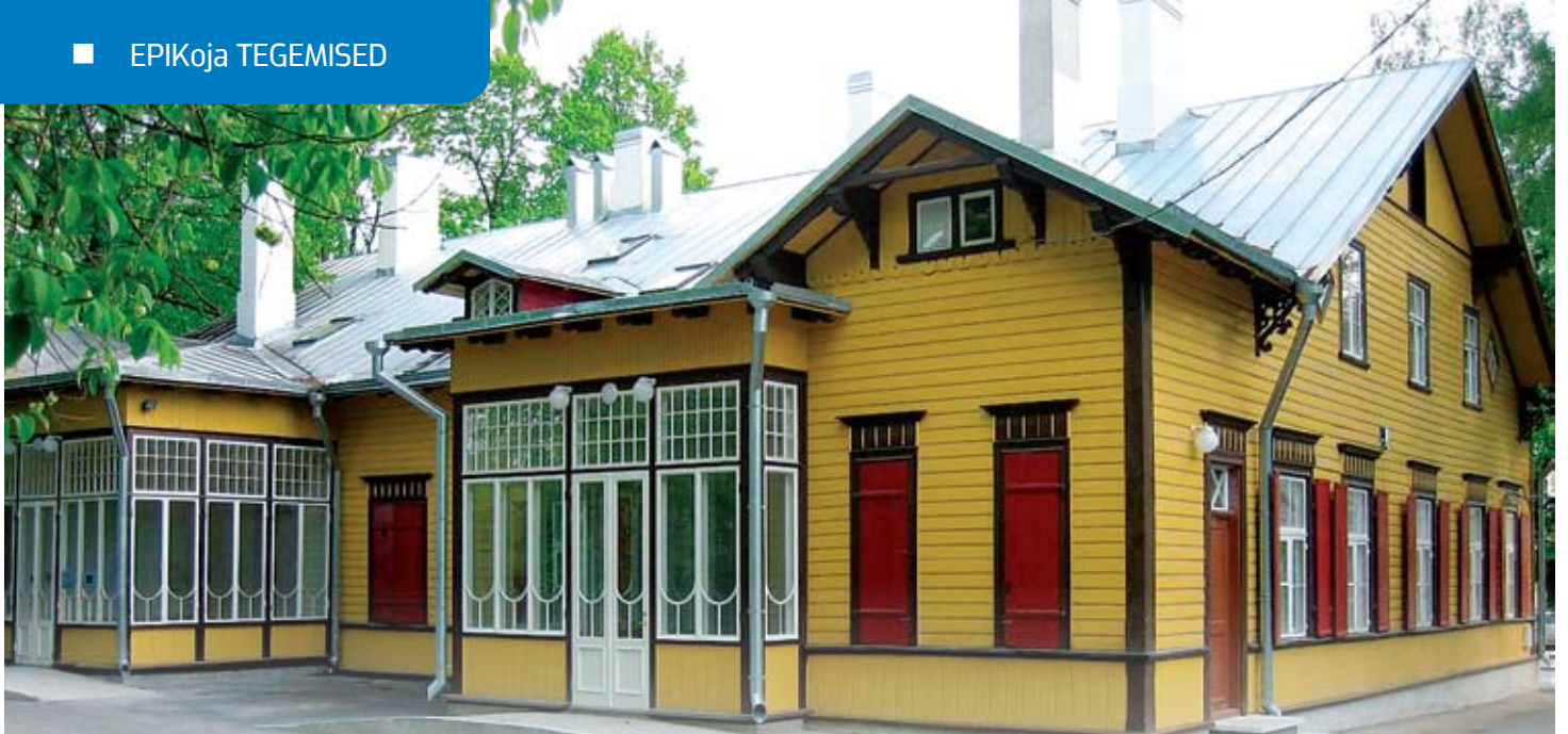
Pildil Eesti Puuetega Inimeste Koda aadressil Toompuiestee 10.