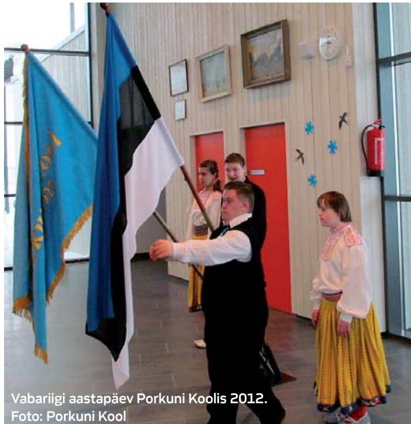
Vabariigi aastapäev Porkuni Koolis 2012.