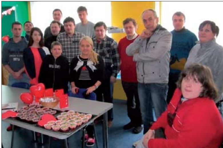
Sõbrapäeva tähistamine 2012. aastal.