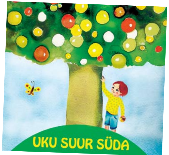
Illustratsioonid pärit raamatust “Uku suur süda”. Joonistuste autor Kudrun Vungi.

Eesti Puuetega Inimeste Koda soovib raamatuga panna lapsi mõtlema, et kõik inimesed ei ole ega peagi olema ühesugused. Erinevus ei tee kellelegi halba ning muudab maailma vaid värvikamaks ja mitmekesisemaks. Samuti loodame kogu EPIKoja poolt, et materjal annab panuse sallivama ning hoolivama ühiskonna kujunemisele.