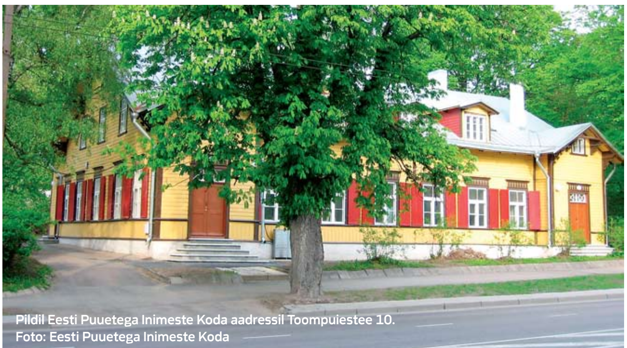
Pildil Eesti Puuetega Inimeste Koda aadressil Toompuiestee 10.