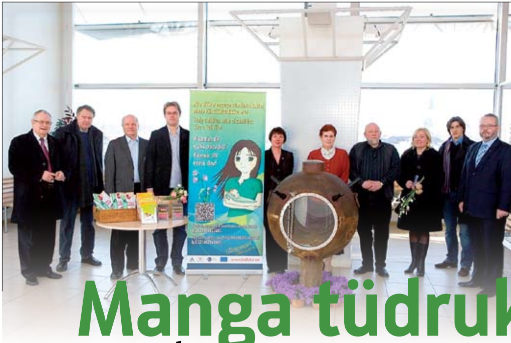
Manga kampaania avamisüritus 8. märtsil Tallinna Sadama D-terminalis.