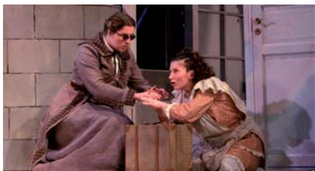
Stseen „Imetegija” lavastusest.

Festivali ajal on võimalik korraldada käsitööde või kunstiesemete näitust ja müüki, millest tuleks kindlasti korraldajaid eelnevalt informeerida. Festivalil osalemiseks tuleb esitada registreerimisleht (küsi Eesti Puuetega Inimeste Kojast või korraldajatelt) 1. juuniks Viljandimaa Puuetega Inimeste Nõukojale. Selle saab saata kas posti teel aadressile Posti tn 20, 71004 Viljandi või e-postiga aadressile kimmel@hot.ee . Kõik festivaliga seotud küsimused, soovid ja ettepanekud esitada festivali projektijuhile Urve Kimmelile eelpool mainitud meiliaadressil või telefonil 5661 8546 .