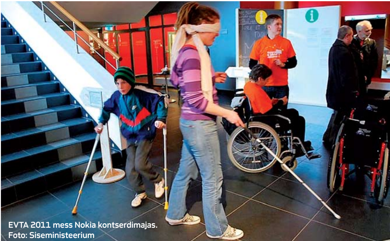
EVTA 2011 mess Nokia kontserdimajas.