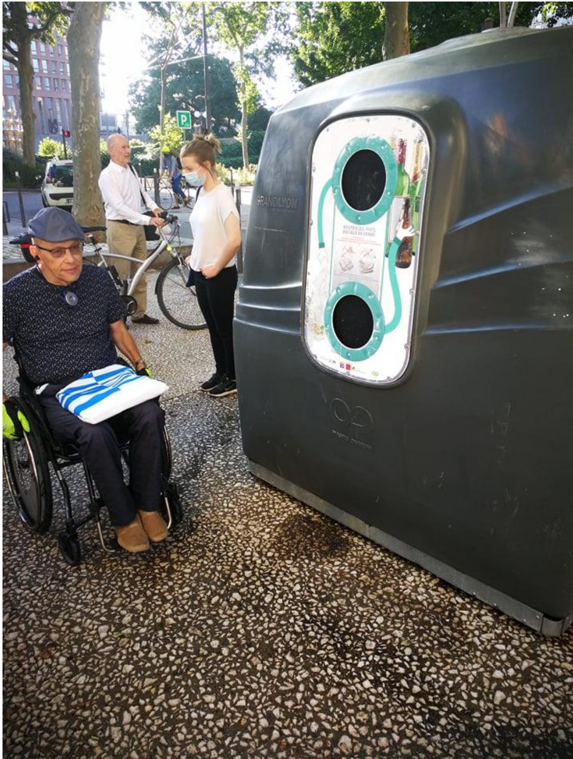
Garibaldi bulvaril on lahendused jäätmete sorteerimise jaoks lastele ja ratastoolikasutajatele.