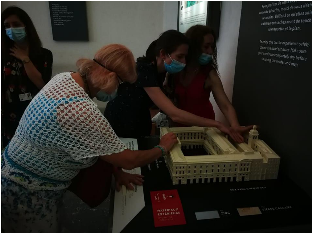
Tutvumas muuseumi maketiga.