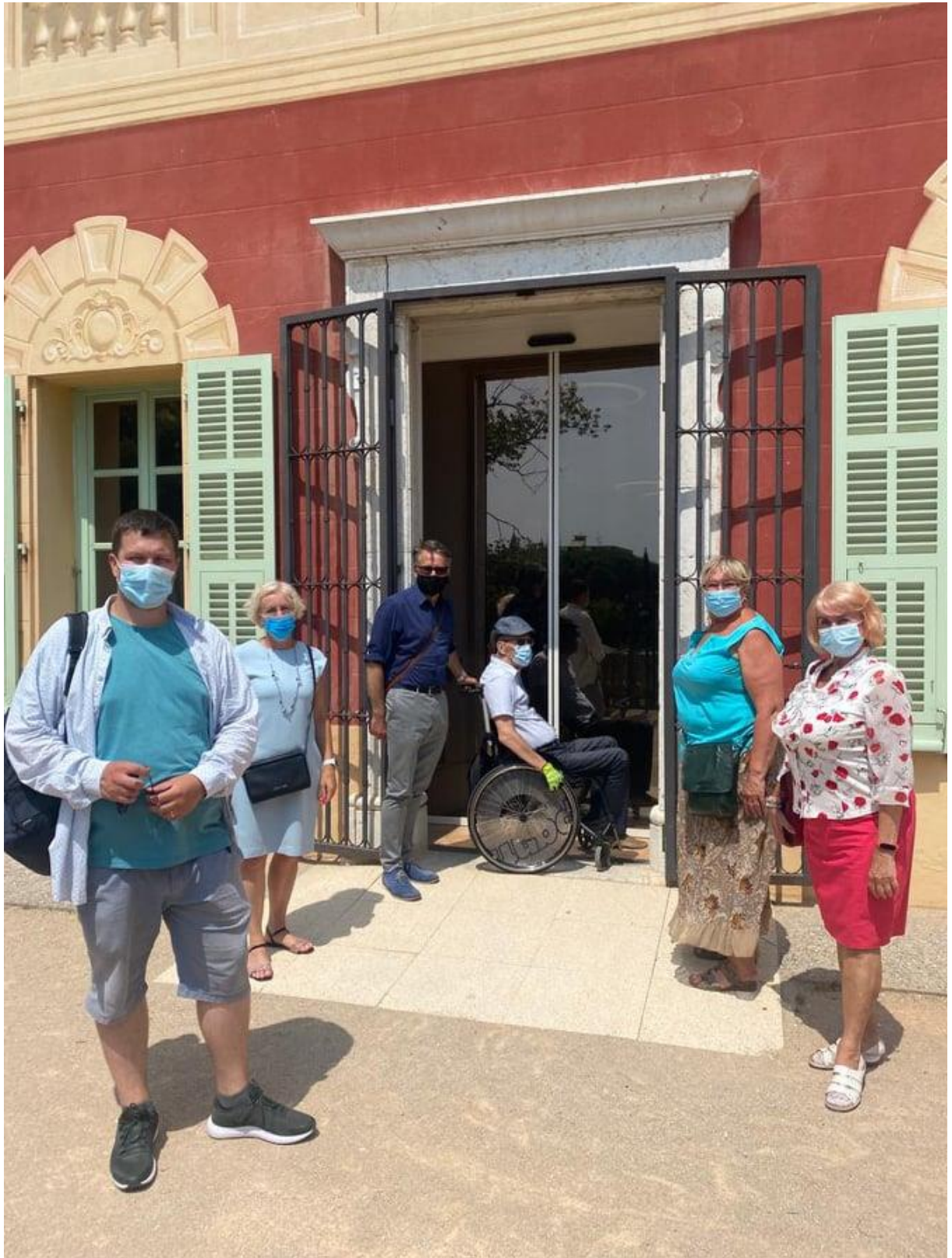
EPIKoja delegatsioon Henri Matisse-i muuseumi ligipääsetava sissepääsu ees.