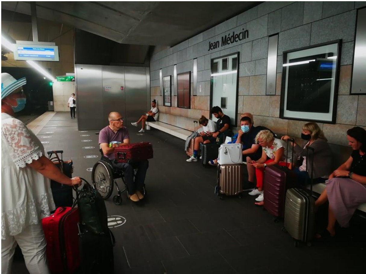
Varahommikul teel lennujaama

Tagasisõit, hotellist lennujaama trammiga, mis on ligipääsetav, mis on kesklinnas maa alla viidud.